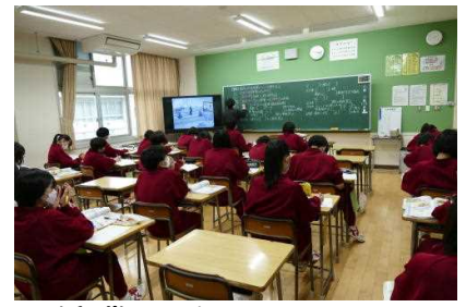
授業も始まりました！